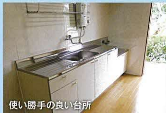
使い勝手の良い台所