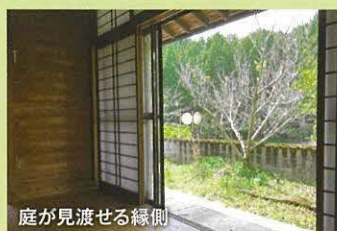
庭が見渡せる縁側